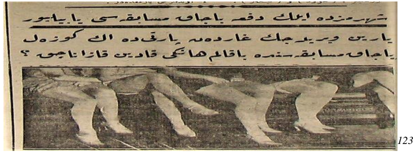
Şekil 8. “Şehrimizde ilk defa kadın bacak müsabakası yapıyor, yarın verilecek partide en güzel bacak müsabakasında bakalım hangi kadın kazanacak?” 124

Son saat gazetesi üzerinde yapılan analizler sonucu gazetenin okuyucu kitlesini de üç ayrı gruba ayırmak mümkündür. Birinci grup çağdaşlaşmayı savunan iktidar taraftarı olan grupken ikinci grup hükümetin karşısında olan muhalefet grubudur. Üçüncü grup ise tamamen Son Saat gazetesinin izlediği satış politikaları sonucunda oluşan bir gruptur. Gazetenin belli dönemlerde satış tirajları çok yüksek olmuştur. Bu durum tesadüf değildir. Türk Tayyare Cemiyeti kurulduktan sonra Son Saat gazetesi aracılığı ile okuyuculara “Tayyare Piyangosu” biriktirme karşılığında altın hediye etmiştir. 125 Sonuç olarak Türk Tayyare Cemiyeti’nin başlattığı kupon biriktirme kampanyası halk tarafından büyük bir ilgi gördüğü için gazete yayını hayatında