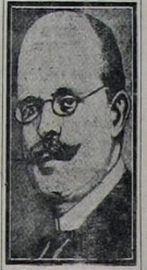
رئیس جمهور آلمان

آلمانیاده بوگون رئیس جمهور انتخابی ایپایبور