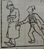
بانیگیک و نغمه