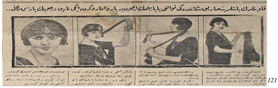
Şekil 7. “Kadınların başlarına sardıkları sarık şeklindeki tülü nasıl yapar? Bütün Avrupa ve İngiltere’de sarık usulü baş yapmak günden güne tamim etmektedir. Bu şekilde yapılan başlar zerafet itibarı ile diğer baş tüllerinden her cihetten daha güzel olmaktadır. Bir İngiliz gazetesi başa nasıl sarık yapılabileceği hakkında bu dört resmi paylaşarak sarık şeklindeki tülün yapım tekniklerini anlatmıştır.” 122