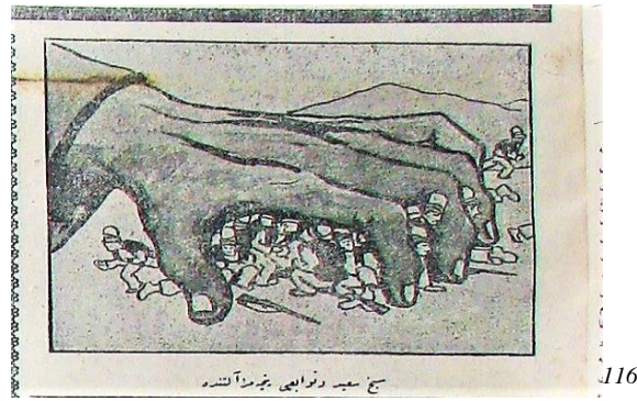
Şekil 5. “Şeyh Sait Ve Adamları Pençemiz Altında.”

Son Saat gazetesi Türkiye'nin 1925'teki iç siyasetini de yakından takip ederek zengin görseller eşliğinde okuyucuya sunmuştur. Mesela Şeyh Sait İsyanı'nı yakından takip etmiş ve isyanın ilk günden beri kontrol altına alındığına yönelik haber ve karikatürleri yayınlamıştır. 2 Nisan 1925'te, gazetenin manşet haber kısmında bu bilgiyi destekleyen şu karikatür gazetede yer almıştır;