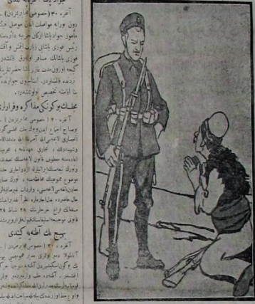
ب قق گره مکر اکر ابریمک بر ستره

فلسفه قضاسی ملت مجلسه کوندر دوی بر فرنده ارجاعی ستره نفسج ایتیمه ونج سعیدی در دست ایده بیک ابر طافان ویره جانی یلدر بر ستره. نفران بوگون مجلسه افزونه مقدر