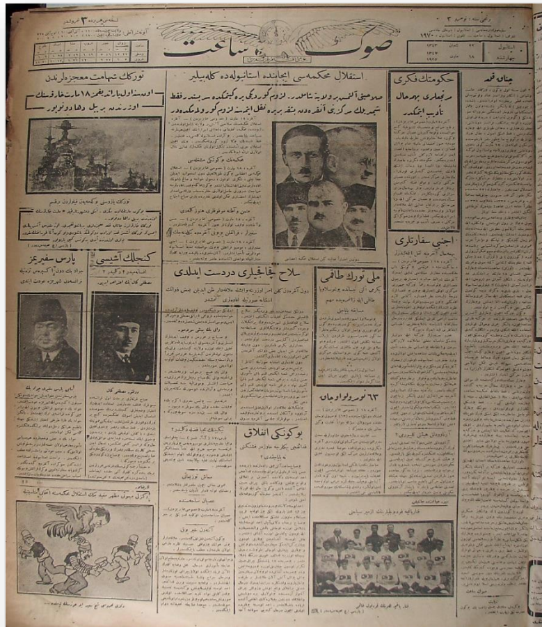
Şekil 13 148 Son Saat gazetesinin sayfa düzeni yukarıdaki gibi tasarlanmıştır. 1925'ten 1928'e kadar gazetenin ilk sayfası 7 sütun olacak şekilde bölümlere ayrılmıştır. Bu sütunlar aşağıya kadar devam etmemiştir. Sütunlar arasında yatay çizgiler ile haber konuları belirgin bir şekilde birbirinden ayrılmıştır. Bu düzen, gazetenin bütün sayfalarında aynı şekilde kullanılmıştır. Manşet haberler gazetenin üst tarafında orta iki sütunda yer almıştır. Spor, tarih ve edebiyat gibi farklı alanlarla ilgili haber ve karikatürler ise gazete sütunlarının alt kısımlarında yer almıştır. Sütunların orta kısmı ise ülke gündemine göre değişiklik göstermiş ancak daha çok İstanbul'da yaşanan sosyal ve kültürel alandaki haberlere yer verilmiştir.

Gazetenin ikinci sayfasında üst sütundaki haberler konularına göre değişiklik göstermiş ancak genellikle ilk sayfadaki haberlerin devamı niteliğinde