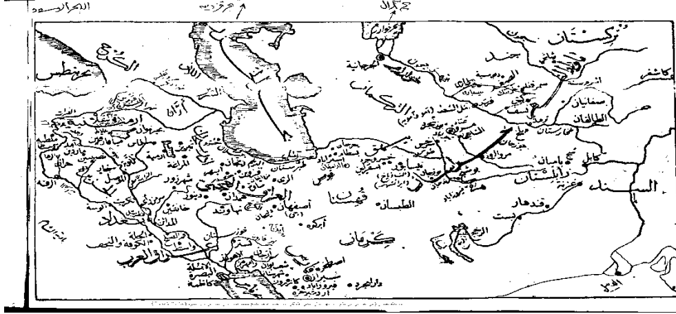
خريطة قديمة لجنوب آسيا، ومنها مدينة بست

مدينة بُست تقع اليوم غربي بلاد الأفغان، على مقربة من الحدود الأفغانية الإيرانية، تنتسب إلى إقليم سجستان، وهي أكبر مدنها بعد زرنج، وكانت منطقة خصيبة وذات بساتين ومجاري الماء، وكانت منذ القدم نشيطة عقليا وتجاريا.