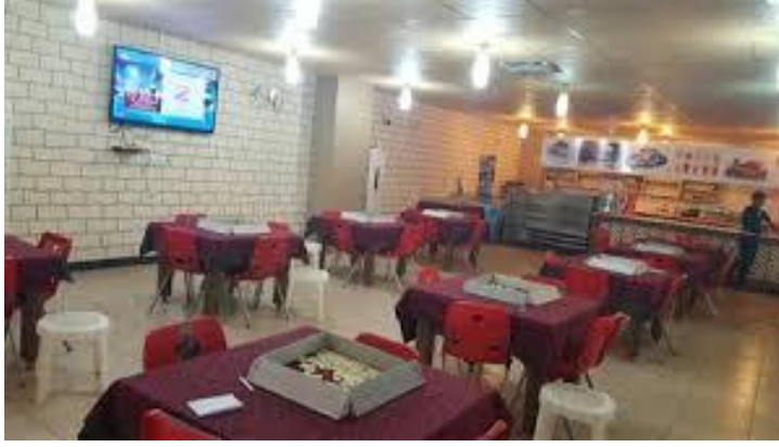
Resim-8: Kafe dikor şekil