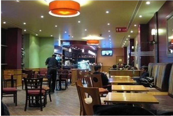
Resim-9 : Kafe dikor İkinci şekil