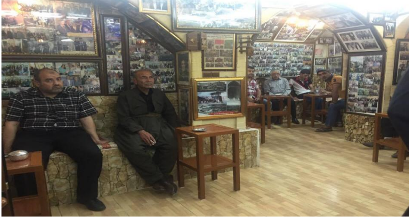
Resim 1: Abo kahvehanesi