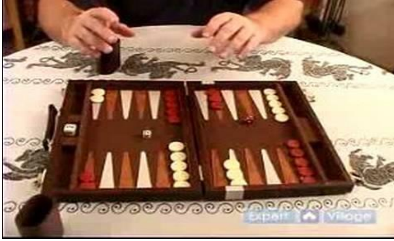
Resim-7: Çayhane ouyn onunma, Tavla (google.com, 2016)