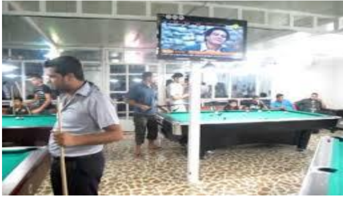
Resim-11 : Gazino dikor İkinci Őekil