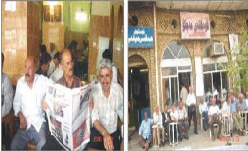
Resim 2: Maçkonun kahvehanesi (Kuna, 2007).