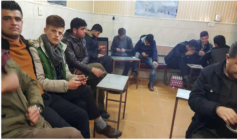
Resim-5: Erbil de Çayhane Dekori (faredun, 2016)