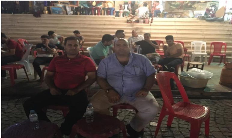
Resim-6 : Erbil de İkinci Çayhane Dekori (Macko, 2016)