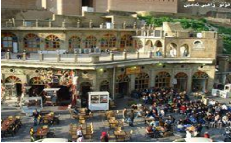
Resim-4: Çayhane yeri Erbil pazarı (Amin, 2016)