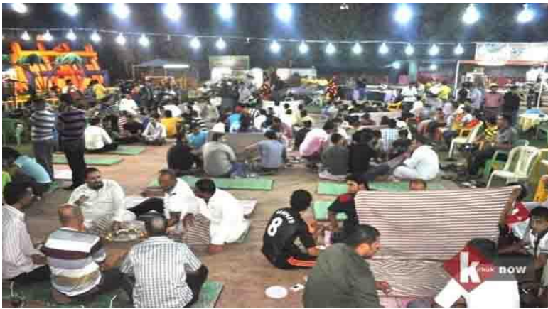
Resim-3 : Ramazan ayı sini zarf oyun oynanır Kahvehanede (bagdady, 2011)