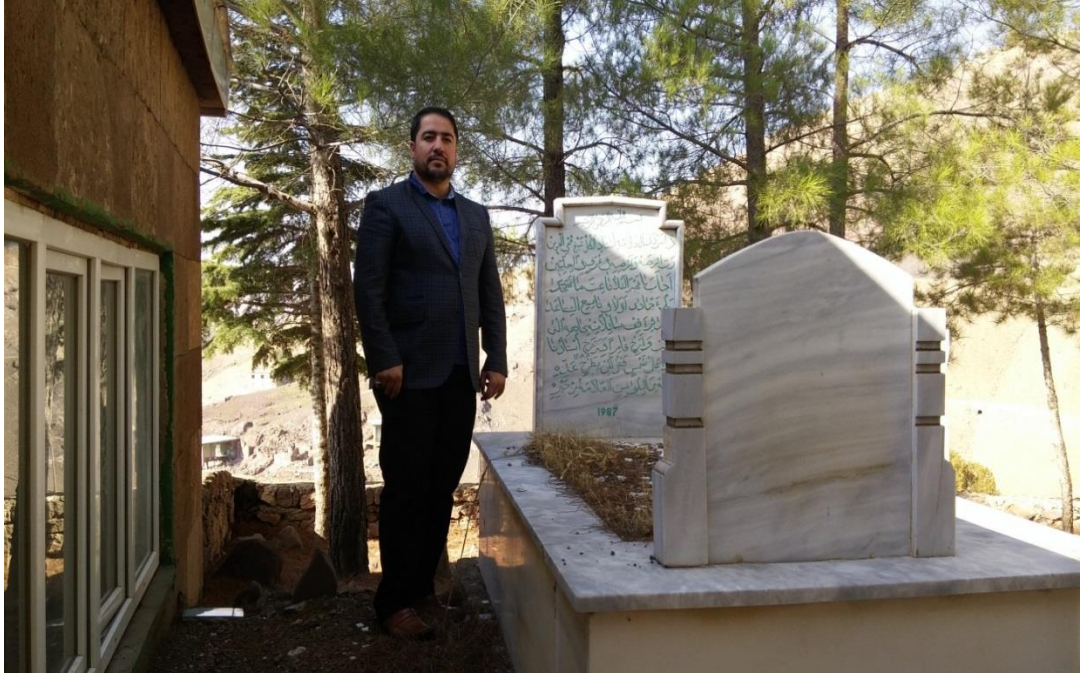
RESİM:4 Mezarımı ziyaret