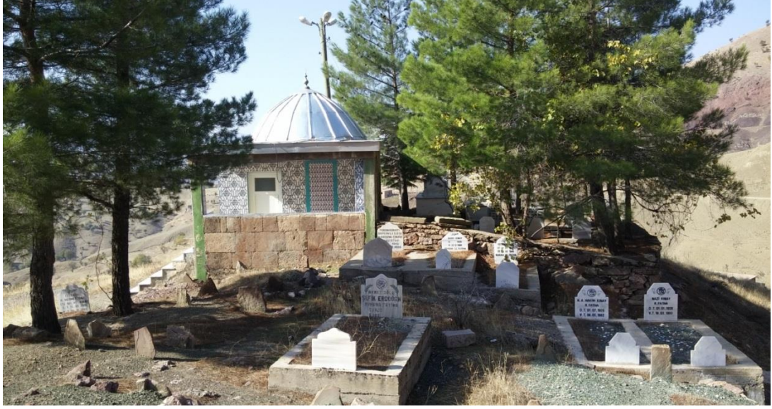
RESİM: 2 268 Yeşilçevre’de bulunan küçük köy kabristanıdır.