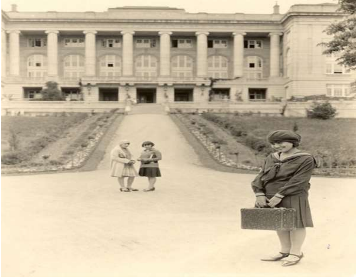
Robert Koleji