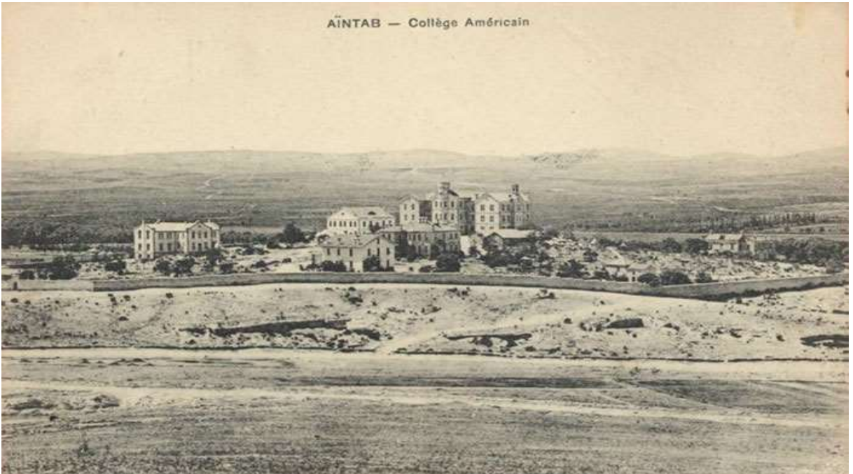
Antep Amerikan koleji