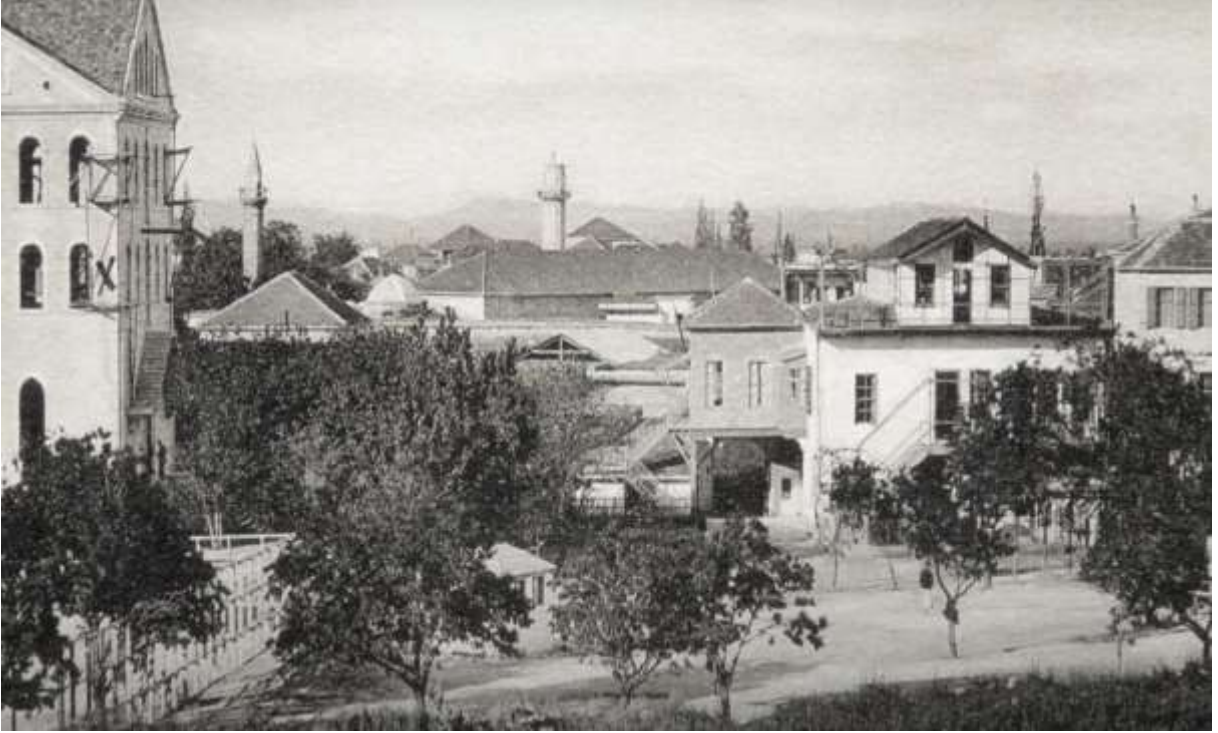
Tarsus Amerikan Koleji