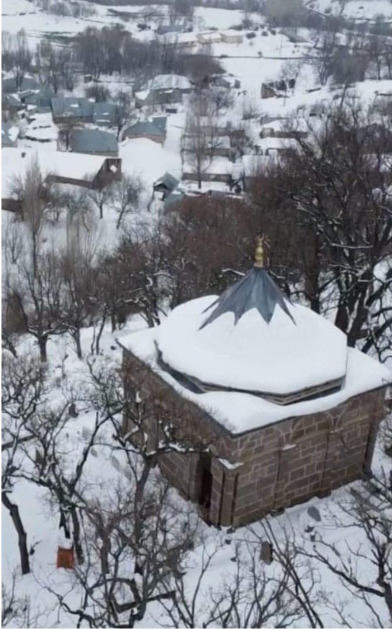
Şekil 3.6- Şeyh Ahmed Çan Türbesi

Türbesi, Genç bölgesi içinde yer alan Lotan köyünde ise Şeyh Alaveddin Türbesi bulunmaktadır.