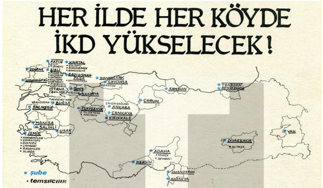
Görsel 3.4. Kadınların Sesi Gazetesi, (1979)

İlerici Kadınlar Derneği, 4 yılda 33 şube, 35 temsilcilik, 15 bin üyeye hızlı bir gelişim göstermiştir. 1970’de grev boylarından köylü eylemlerine, işçi direnişlerinden seçim mitinglerine kadar sınıfsal ve toplumsal mücadelenin her alanında kadınlar etkin olduğu için demokrasi savaşında büyüyen rollerden ayrı düşünülmemektedir. İKD’nin hızlı gelişimi bu somut durumdan kaynaklanır. Aynı zamanda bu potansiyel durumu harekete geçirip yönlendirebilecek, doğru ilkelere dayalı bir örgütlenme gerekir. İKD zamanla doğru ilkelere dayalı bir örgütlenme içerisinde olduğunu çalışmalarıyla kanıtlamıştır. İlk politik görüşü ne olursa olsun, emperyalizmle bütünleşmiş bir avuç tekeli burjuvazinin dışında tüm sınıf ve katmanlardan kadınları örgütlemeyi hedeflemiştir. Bu yüzden İKD’nin üyeleri arasında sosyalistler ve sosyal demokratlar olduğu gibi, hiçbir politik bağlantısı olmayan kişiler de vardır. Sadece kâğıt üstünde kalan üyeliklerden ziyade, kadınların yığınsal ve örgütlü biçimde eşitlik, demokrasi ve barış savaşımına katılmasını sağlamakta önemli başarılar elde etmiştir. İKD’nin okuma-yazma kurslarıyla okumayı öğrenen kadınlar yasa tasarılarını kınamak için kampanyalar düzenlemiştir; ülkenin her yerinde işsizliğe, pahalılığa, evlat acısına karşı eylemler başlatmıştır (Kadınların Sesi, 1979, s.2-12).