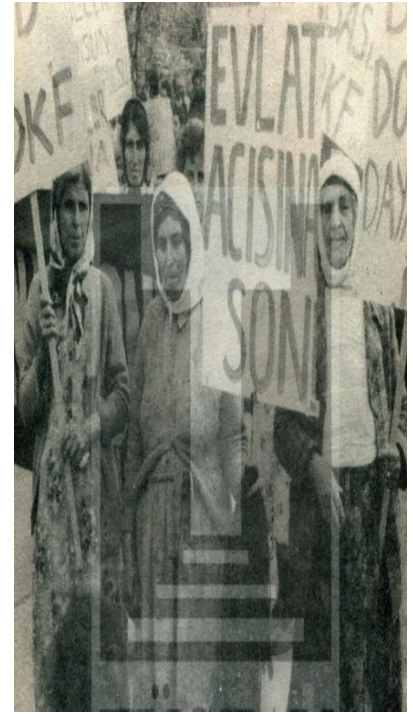
Görsel 3.12. Kadınların Sesi Gazetesi, (1978)

İKD, 1978 yılında böylesi bir ortamda ve birçok şehirde düzenlenen faşist katliamları protesto için yürüyüşlere aktif olarak katılır. Tüm bunların sonucunda dernek, anti-demokratik uygulamalara ve polis baskınlarına maruz kalır. Derneğin çoğu şubesi kapatılırken, bazılarının kapısına kurt resmi çizilerek ateşe verilmiş ve yakılmıştır. Bu olaylar sonucunda bazı dernek üyeleriyle mülakatlar yapılmış ve üyeler son dönemlerde İKD’nin fazlasıyla sola kaydığından ve keskinleştiğinden bahsetmişlerdir. Bunun nedeni ülkenin o dönemlerde içine girdiği kısır döngü ile