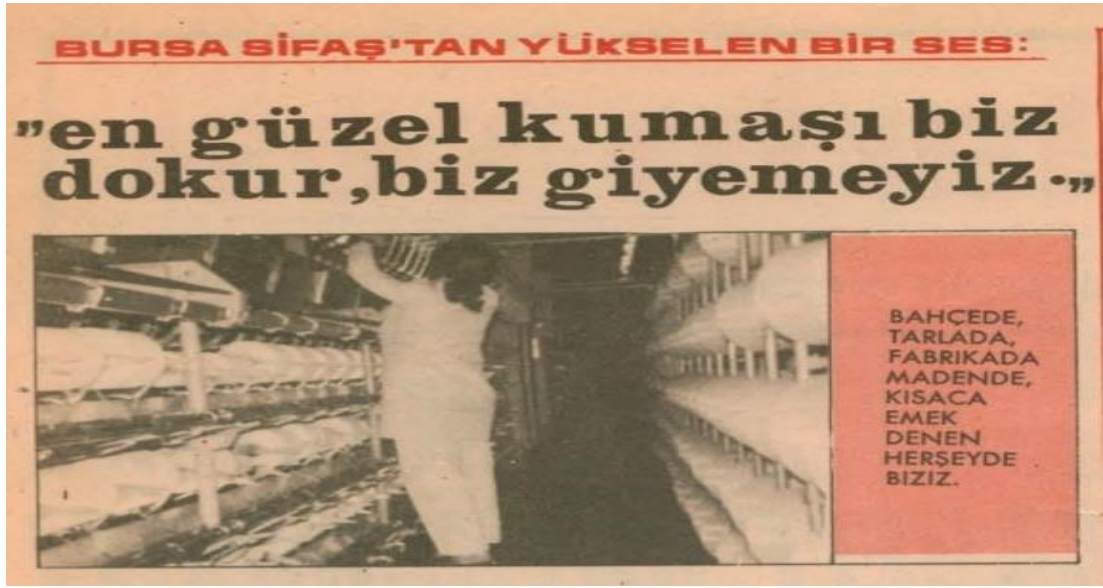
Görsel 3.14. Kadınların Sesi Gazetesi, (1977)