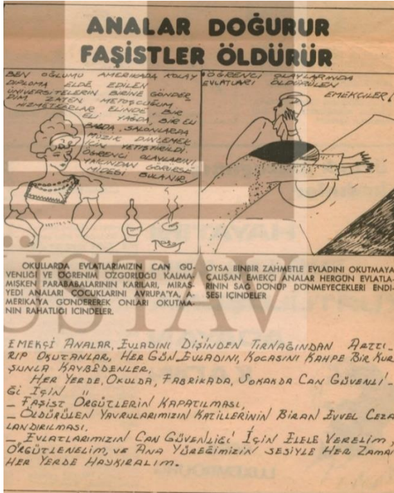
Görsel 3.11. Kadınların Sesi Gazetesi, (1979)

edilirken, öte yandan kadın emeğinin ve cinselliğinin sömürüldüğüne vurgu yapılmıştır. Kadınların bu konumdan kurtarılmasının gerekliliği ve bunun içinde yapılması gereken eylem programı belirlenerek talepler hayata geçirilmeye çalışılmıştır. İKD bir yandan doğrudan kadınları ilgilendiren konularda kampanyalar düzenlerken diğer yandan Türkiye’de artan cinayetlere karşı kamuoyu tepkisi oluşturmak için “ Evlât Acısına Son ” kampanyası başlatmıştır. 1980 yılına kadar siyasi nedenlerle öldürülenlere dikkat çekmek için “ Analar doğurur, Faşistler Öldürür ”, “ Analığa Saygı ”, “ Analara En Güzel Hediye Can Güvenliği ” belgeleri ile yürüyüşler yapılmış ve saldırılar kınanmıştır (Akal, 2003, s.178-184).