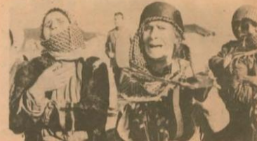
Görsel 3.1. Kadınların Sesi Gazetesi, (1977)

Kadınların ucuz çalıştırılarak emekçiler olmaktan çıkarılarak, emeğin kadın erkek farkı gözetilmeden eşit olarak ücretlendirilmesi için mücadele edilmeli, böylece işverenlerin kadınların sırtından ilâve kâr sağlamasına, erkek işçilerin ucuz kadın emeğiyle tehdit edilmesine son verilmelidir.