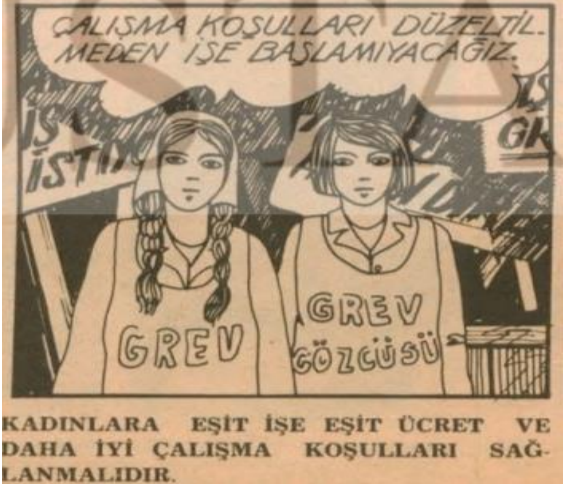
Görsel 3.8. Kadınların Sesi Gazetesi, (1976)

gündeme getirilebilmiş ve ilk defa bir Sosyal Güvenlik Bakanlığı ev kadınlarını BAĞ-KUR kapsamına alacak bir yasa tasarısı hazırlamış ve TBMM'ye sunmuştur (Pervan, 2013, 367-368).