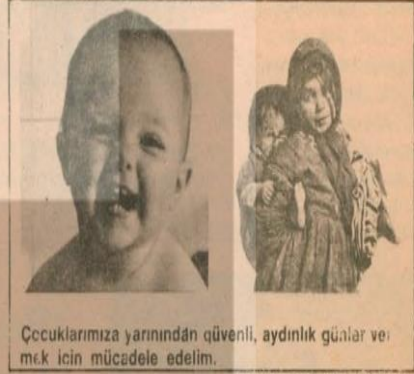
Çocuklarımıza yarından güvenli, aydınlık günler ve mek için mücadele edelim.

«Okul kitaplarında, savaşlara değil barışa övgü dü-