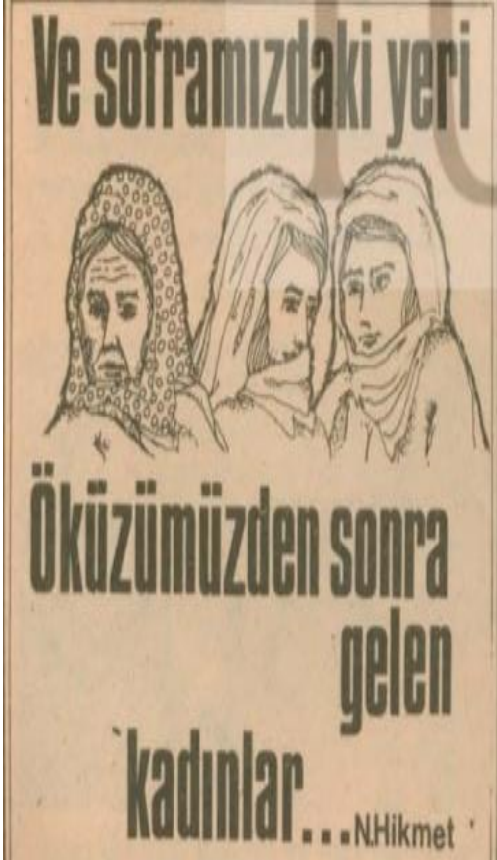
Görsel 3.16. Kadınların Sesi Gazetesi, (1976)