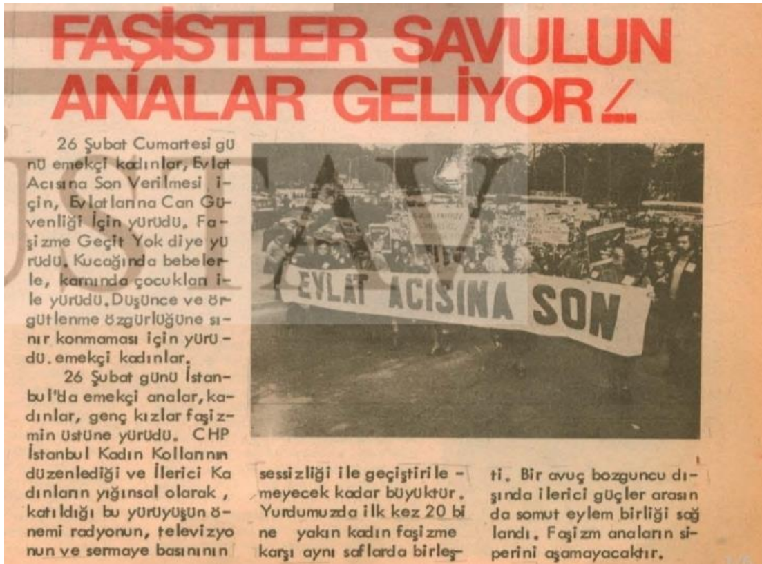
Görsel 3.13. Kadınların Sesi Gazetesi, (1978)

bağlantılı olarak, İKD'nin ağırlıklı olarak anti-faşist eylemlere yönelmesidir. Çünkü 1970'li yıllara bakıldığında enflasyon ilk kez yüzde yüzlere ulaşmış; gaz, yağ, ampul, çay gibi temel gıdalar piyasadan çekilmiş; işsizlik ve yoksulluk artmıştır. Aynı zamanda ülkede toplumsal mücadele faşist ve devrimci olarak ikiye ayrılmıştır. Üniversite öğrencilerinin polis korumasıyla okullara girip çıkabildiği; savcılarının, öğretim üyelerinin, sendika başkanlarının öldürüldüğü ve katillerin bazı parti binalarında yakalandığı, daha sonra hapisten kaçırıldığı ve devletin bu olayları engelleyemediği bir dönemdir (Akal, 2003, s.185). Tüm bu nedenlerden dolayı kadın sorunlarından ziyade anti-faşist bir mücadele öne çıkmıştır.