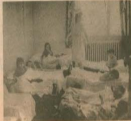
Görsel 3.10. Kadınların Sesi Gazetesi, (1978)

Her iş yerinde kreş için emekçi anneleri, sendikaları ve hukukçuları savaşım vermeye çağırıyoruz.