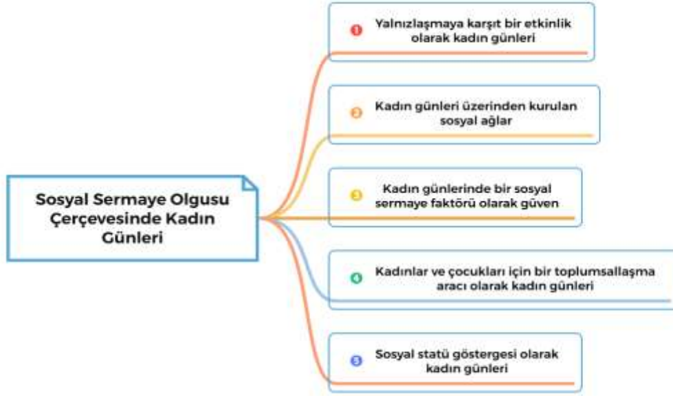
Şekil 3. 2: Temalar

Yapılan araştırma 5 tema üzerinde şekillenmiştir. Bu temalar araştırmanın amacına göre oluşturulmuştur. Oluşturulan temalar Şekil 3.2 de yer almaktadır.