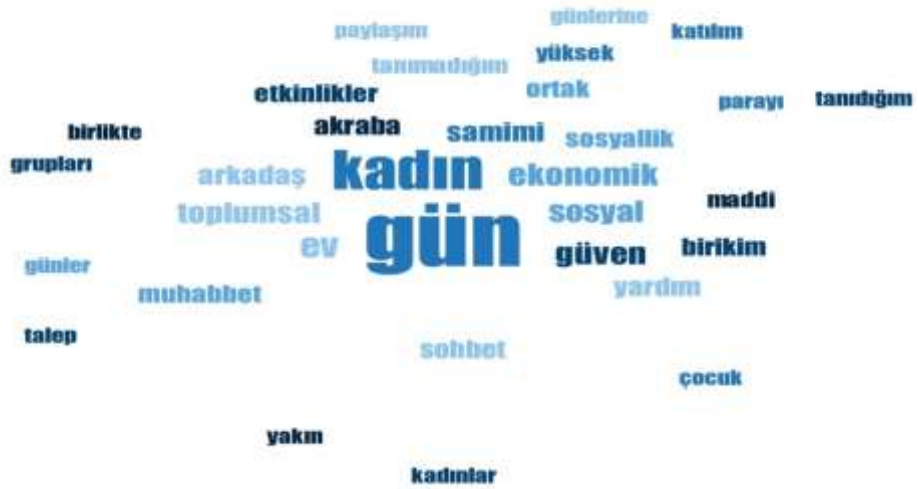
Şekil 3. 1: Kelime Bulutu

Çalışmaya katılan katılımcıların ses kayıt deşifreleri için “Maxquda” programından yararlanılarak kelime bulutu oluşturulmuştur. Katılımcıların sıklıkla kullandıkları kelimeler Şekil 3.1 Kelime Bulutun da gösterilmektedir.