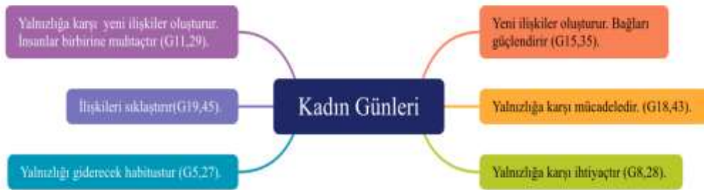
Şekil 3. 4: Yalnızlaşmaya Karşı Kadın Günleri

Katılımcıların dile getirdiği görüş kadın günlerinin topluma olumlu etkilerinin olduğunu ve bir toplumsallaşma yolunda güzel bir adım olduğu gözlemlenmektedir. Katılımcıların kadın günlerinin yalnızlaşma olgusunu nasıl anlamlandırdıkları şekil 4’ te verilmiştir.