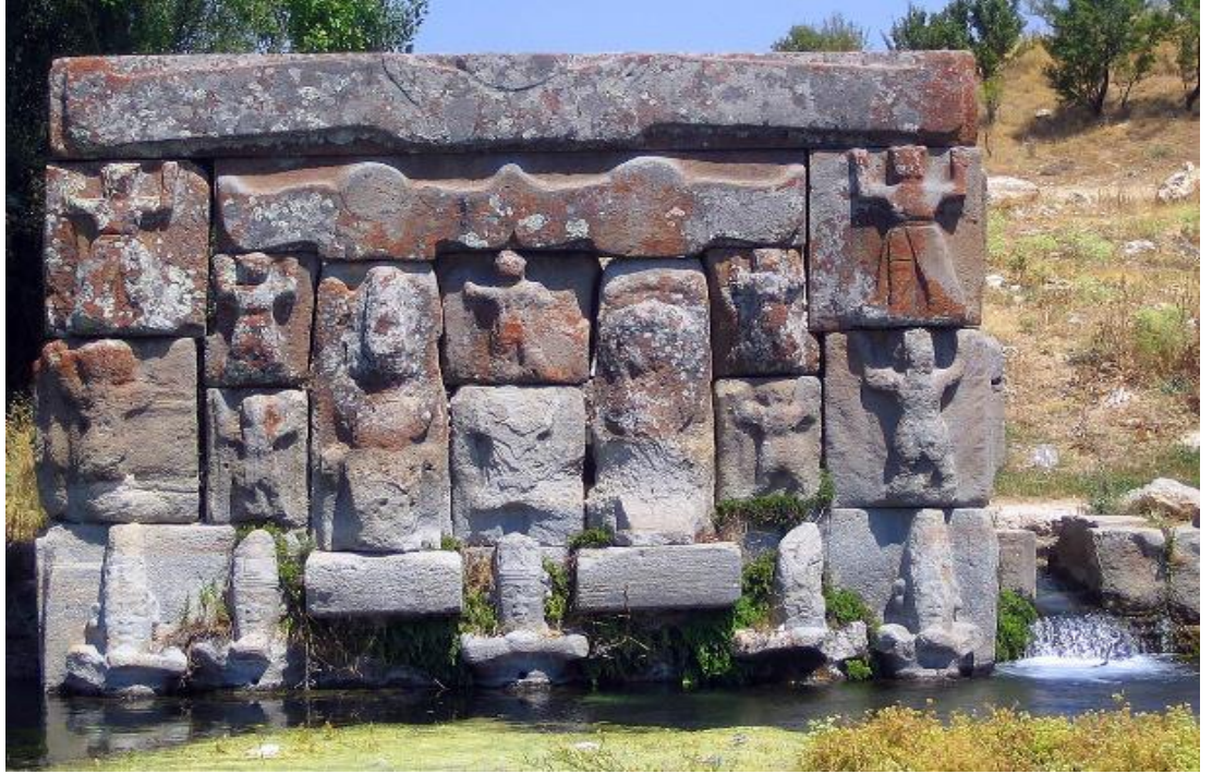
Resim 4. Hititler Dönemi'nde yapılan Eflatunpınar Su Anıtı. bkz. https://www.kulturportali.gov.tr/turkiye/konya/gezilecekyer/beysehir-eflatunpinari-hitit-su-aniti

mekânın IV. Tudhaliya döneminde yapıldığı ve Boğazköy'deki Yazılıkaya'dan sonra en önemli dini merkez burası olduğu sanılmaktadır 407 .