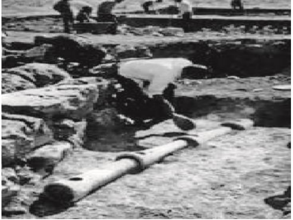
Resim 3. Kazılarda Bulunan Atık Su Boruları. (Hitit kentlerinde atık su, pişmiş toprak künklerle evlerden toplanarak sokakların altındaki kanalizasyona bağlanıyordu.) bkz. Serap Gümüsoğlu, Turan Soğukoluk (Ed.), İlkler İmparatorluğu'nun Başkenti Hattuşa , Dumat Ofset, Ankara 2017, s. 13.

Büyükkale'deki Hitit İmparatorluk Çağı'na ait su borusu kalıntılarına rastlanmakla birlikte burada da Alacahöyük'teki gibi atık sular tali kanallar yoluyla 80 santimetre genişliğindeki ana kanalda toplanarak tahliye edilmiştir. Bunun örneği borular, Büyükkale IVb tabakasında, Aşağı Şehir'deki Büyük Tapınak'ın güney sahasında, Yazılıkaya ve Alacahöyük'te mevcuttur 388 .