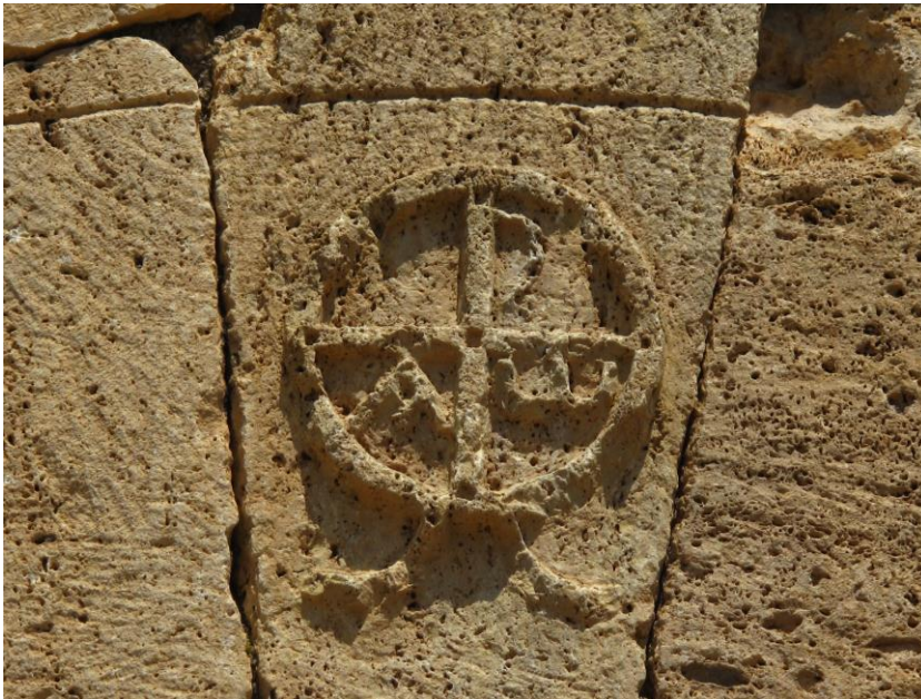
Fotoğraf 3: Hierapolis-Aziz Philippus Mezar Yapısındaki EM-AM Damgası