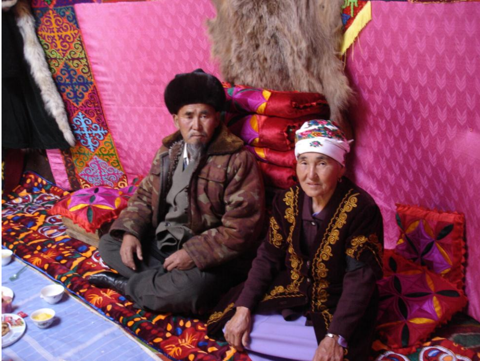
Fotoğraf 8: Kırgızistan-Susamır Bölgesi- Göçmen Çadırından Bir Görüntü

Kırgızistan’ın bayrağında da bugün gördüğümüz motif, İç Oğuz’un kullandığı OĞ damgasıdır. Bu damga günümüzde halen Kırgızistan’daki keçe yapımı çadır evlerin tepe penceresinin formunu teşkil etmektedir.