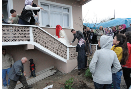
Damadın Üzerine Saçı Atılırken