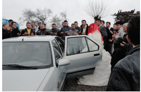
Damat Eve Girmeden Önce Dua Ederken