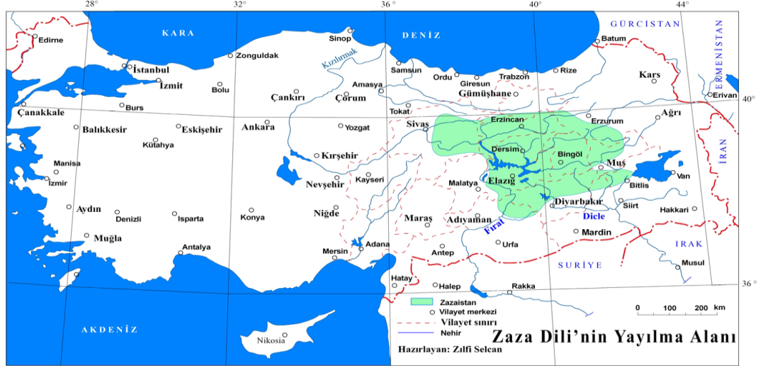
Harita 1. Zazacanın yayılma alanı 46

Anadolu coğrafyasında Zazaların meskûn alanlarına yer verilmiştir.