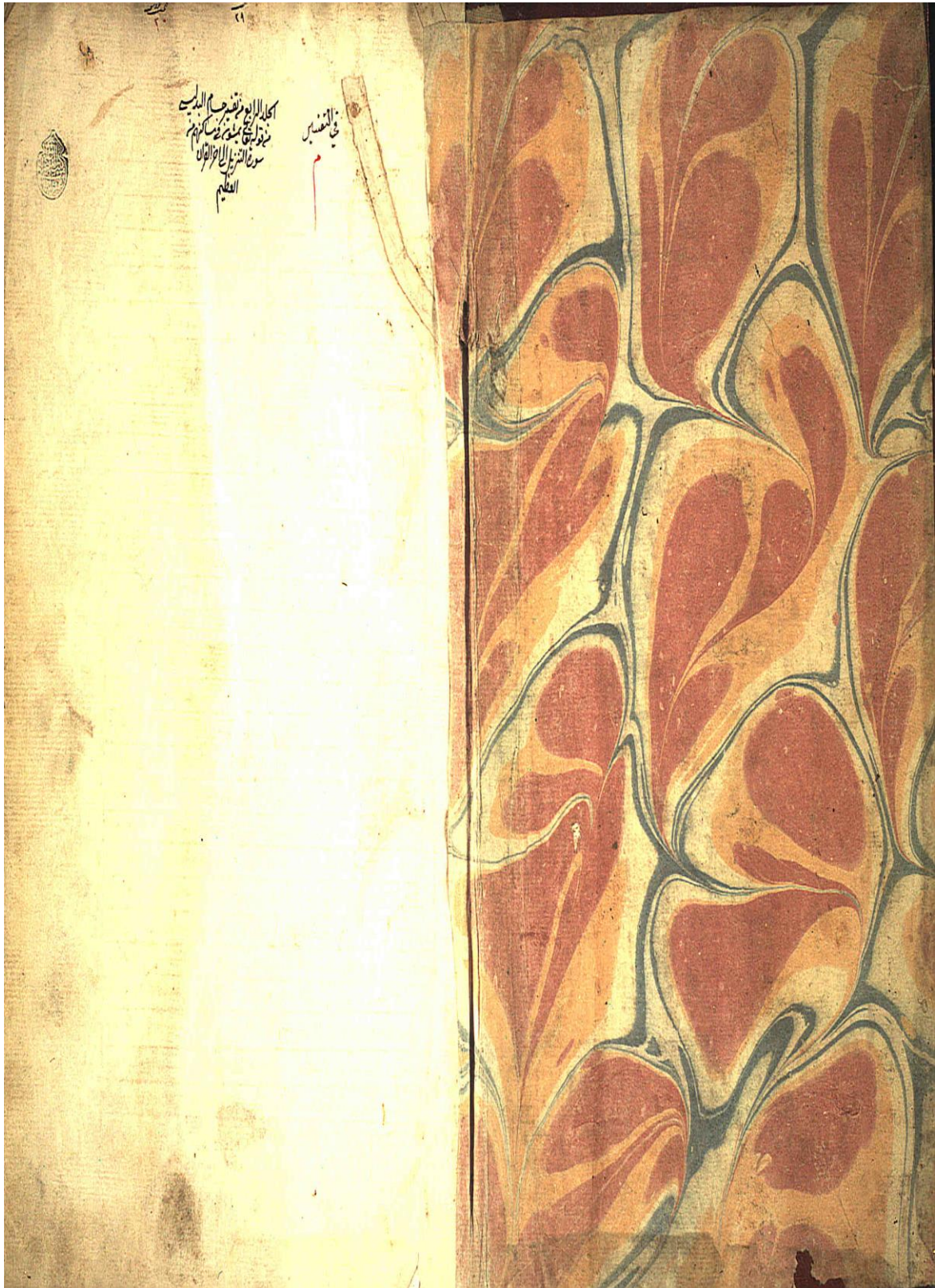
رسم توضيحي 4الصفحة الأولى بعد الغلاف لنسخة الأصل