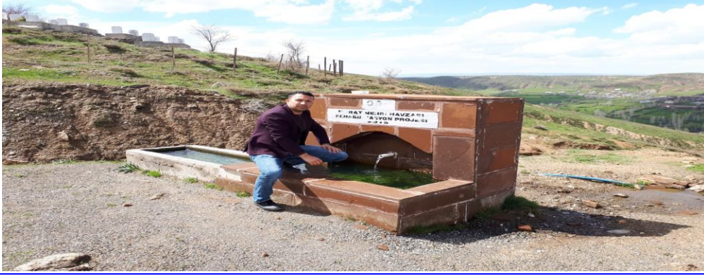
Şekil 6. Çeşme yapımı faaliyetleri