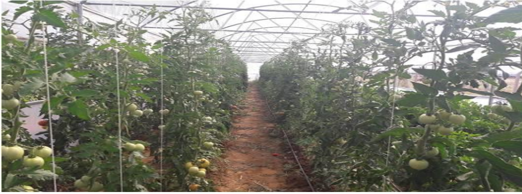
Şekil 7. Örtü altı sebze yetiştiriciliği (Sera)