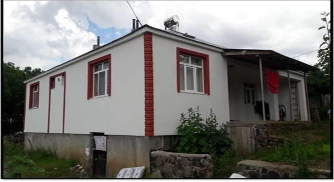
Şekil 8. İzolasyon (evler için)