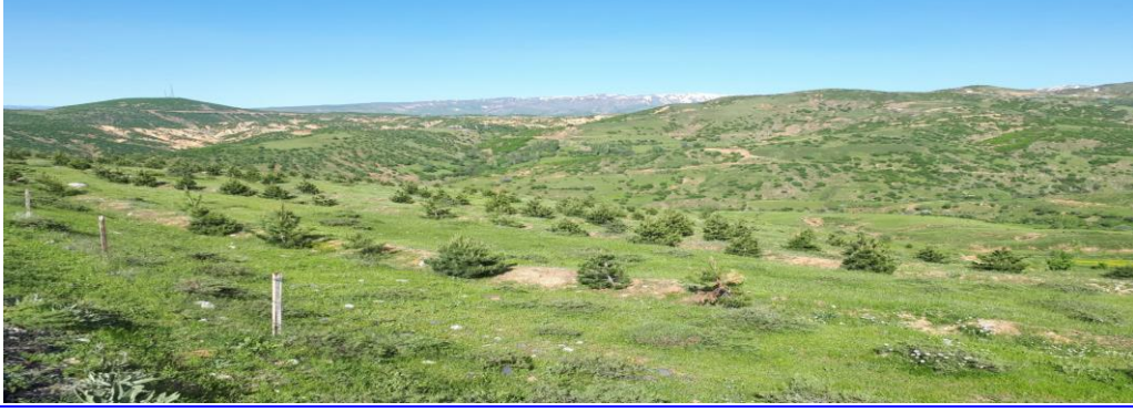
Şekil 5. Ağaçlandırma (çam, sedir, akasya vb) faaliyetleri

(canlandırma kesimi) ifadelerinin katılım düzeyleri yüksek olarak çıkmıştır. Bu faktörlerin hem standart sapması hem de ortalama düzeyleri düşük, katılım düzeyi ise yüksek olduğu tespit edilmiştir.