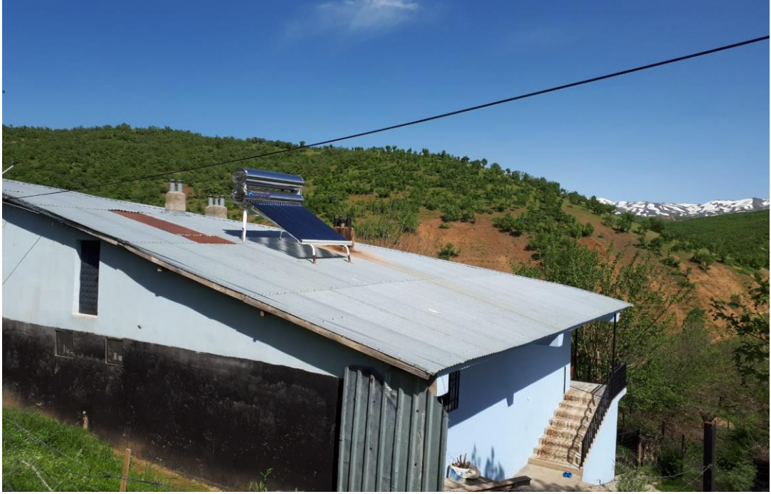
Şekil 9. Güneş enerjisi faaliyetleri