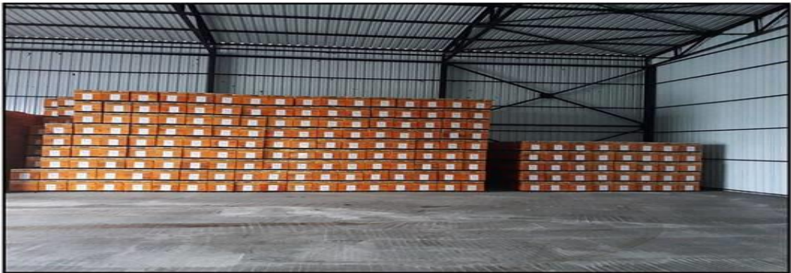
Şekil 3. Kovan Dağıtım

Cevap verenlerin tarım ve sulama ile ilgili kovan dağıtım konusundaki bakış açıları sorulduğunda %51,5'i için çok önemli, %48,5'i önemli şeklinde cevap vermiştir.