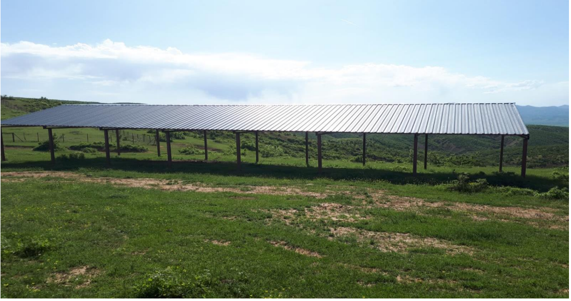
Şekil 4. Gölgelek, Sıvat, Tuzluk, Kaşınma Kazığı