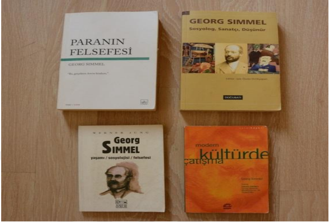
Resim-7: Simmel'in Kendi Eserleri