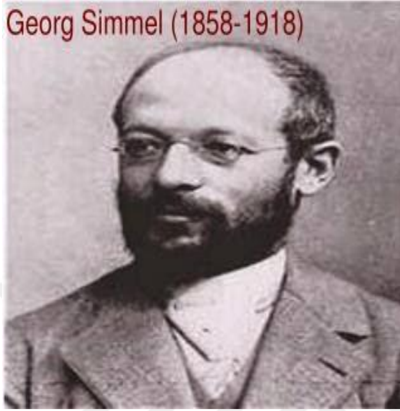
Resim-5: Georg Simmel'in Portresi