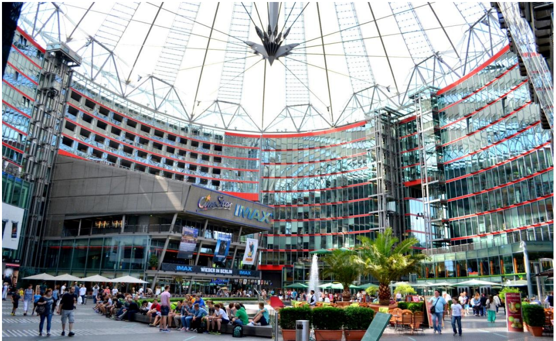
Resim-4: Günümüzde Berlin-2

http://canergz.com/kategoriler/yazilar/seyahat/almanya/berlin/ , Erişim: 15.10.2016