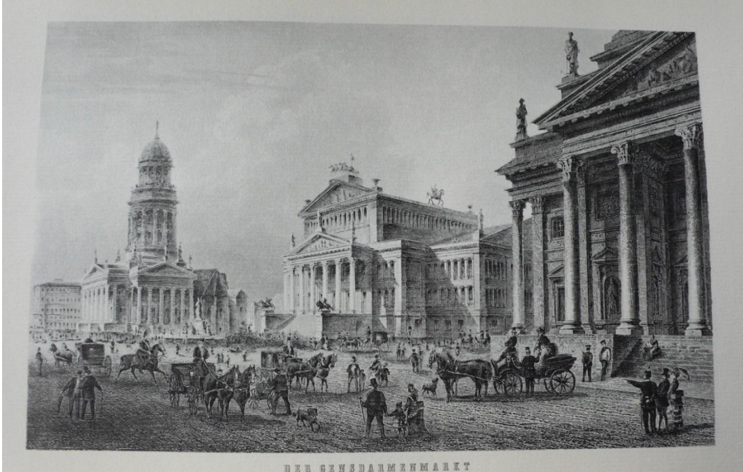
Resim-2: 1800'lü Yıllarda Berlin-2, http://blog.visitberlin.de/en/7374-11-berlin-highlights-for-2016.html , Erişim, 04.10.2016