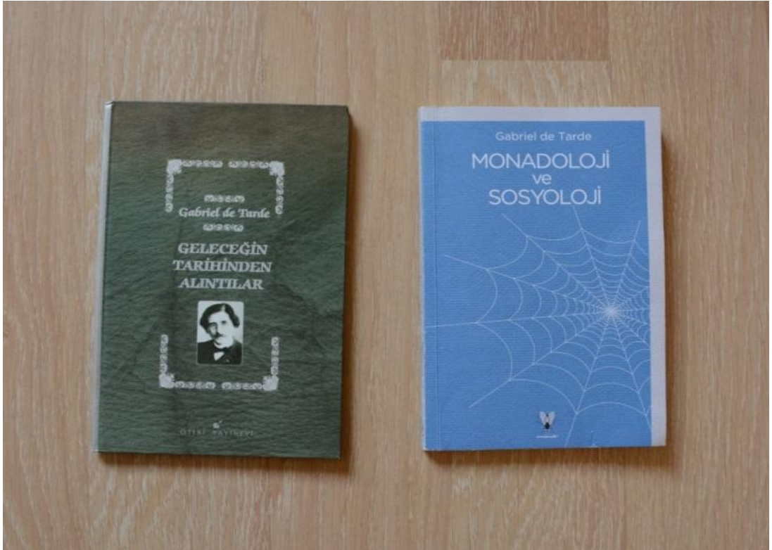
Resim-8: Gabriel de Tarde'nin Eserleri