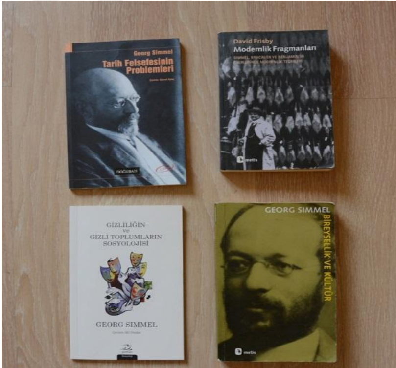
Resim-6: Simmel'in Eserleri ve Onunla İlgili Çalışmalar