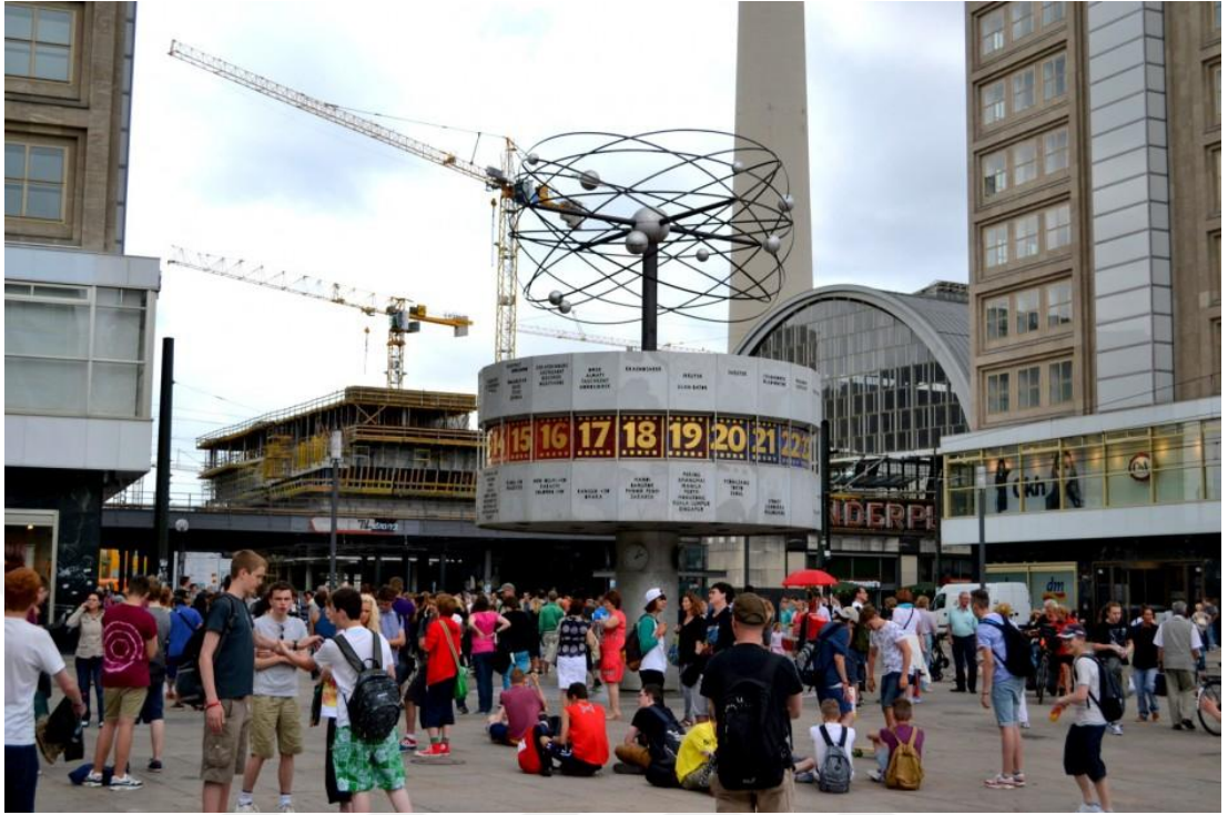
Resim-3: Günümüzde Berlin-1

http://canergz.com/kategoriler/yazilar/seyahat/almanya/berlin/ , Erişim: 15.10.2016