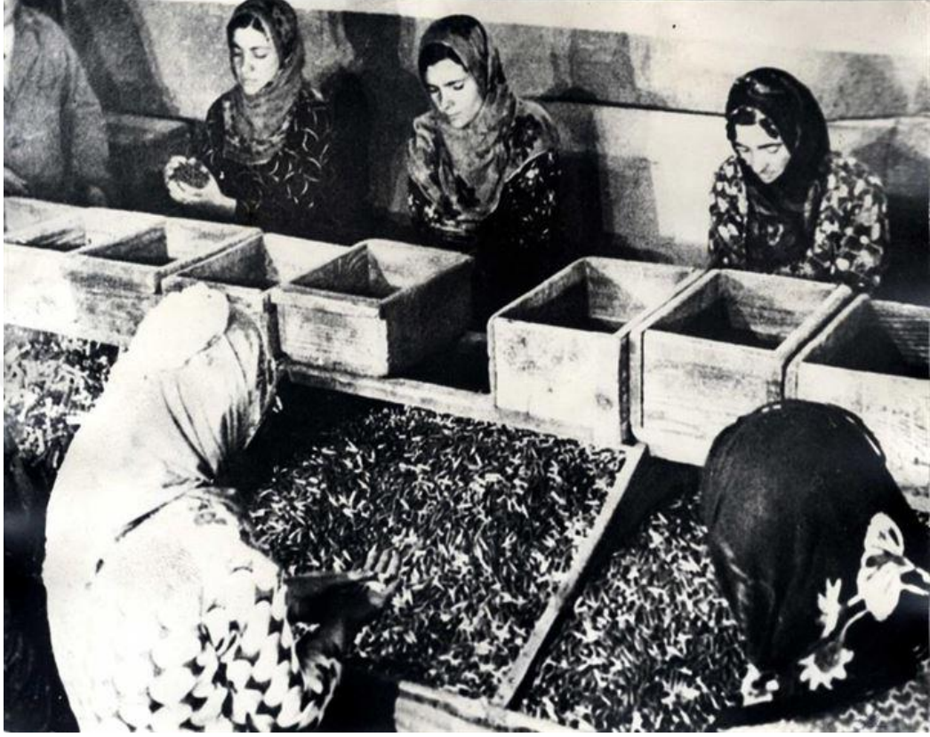
Fotoğraf 10: TİTE Arşivi , FK37610B10. Kadın kahramanlarımız cephe gerisinde ordumuzun ihtiyaçlarını karşılamak için var güçleriyle cephedeki askerler için mermi hazırlarken.