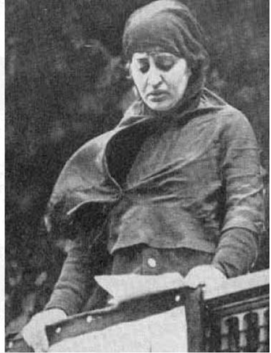
Fotoğraf 6: İstiklal Harbigazetesi ,24.05.1919, no:11,Gazetenin haberinde, Halide Edip'in Sultan Ahmet meydanındaki akıllarda kalan o coşkulu konuşmasından bir kare.