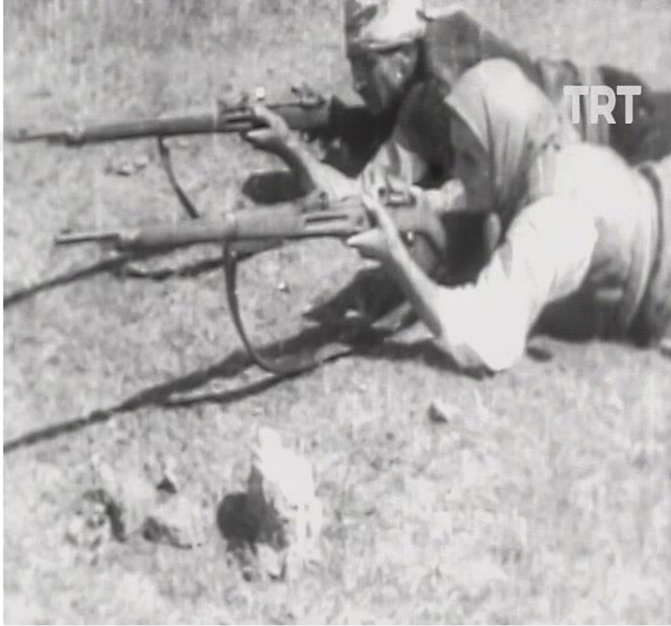
1919-1922 Kurtuluş Savaşı, Video Görüntüsü, 02.43.