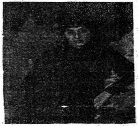
«Yalan haberlere inanmayınız» diye haykırarak, halktan hayecanını devam ettirmişti. Türkiye için mücadelede geri kalmamasına isteyen mücahimlerimizdir. Halide Edip, hayecanıyla, evlatları birleşmelerini ve evlatları birleşmelerini istedi.

Münevver Saima hanım «Bir genç kızın feriyadını bir konuşma söyleyene» sözleri ile başladığı konuşmasında demiştir ki: