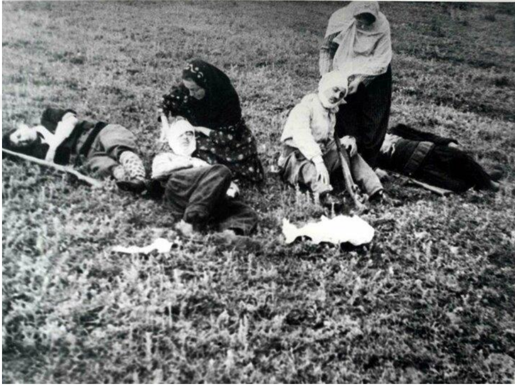
Fotoğraf 23: TİTE Arşivi, FK36G71B71. Kadınlarımız cephe gerisinde yaralıları tedavi ederken objektiflere yansımış olan bir fotoğraf.