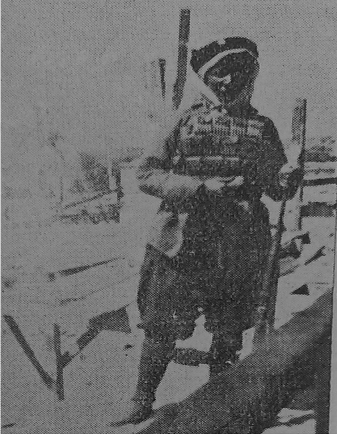
Fotoğraf 31: Adile Hanım , Tercüman-ı Hakikat, 23 Eylül 1921, s. 3.