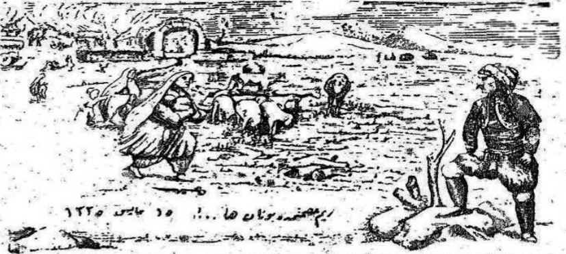
ANADOLU'NUN, MEHMET'İNİN İSYAN EDECEĞİNİ İMA EDEN BİR TABLO: SORUYOR MEHMET: HARİMİ İSMETİMDE YUNAN HAA... 15 MAYIS 1335.