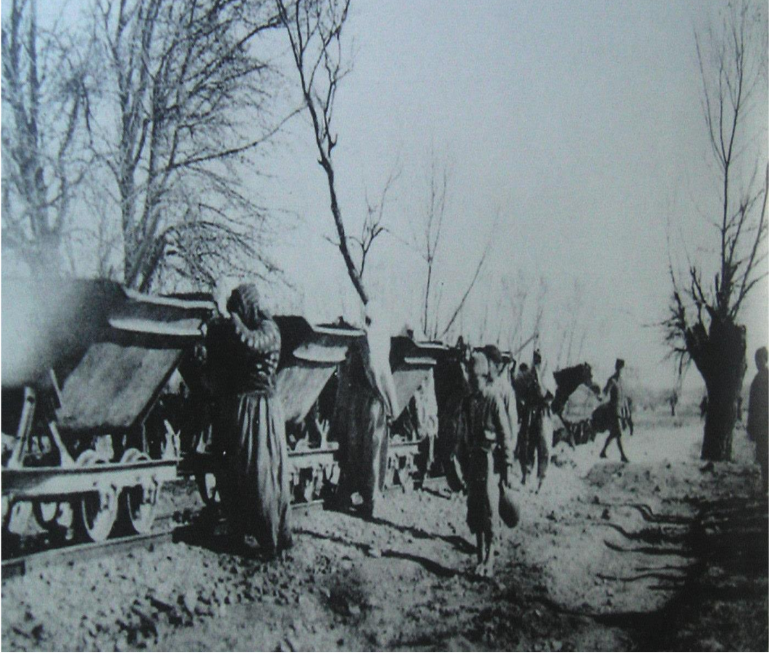
Fotoğraf 18: Bu fotoğrafta kadınlarımızı, işgalci devletlerin tahrip etmiş oldukları demiryollarını tamir ederken görmekteyiz.