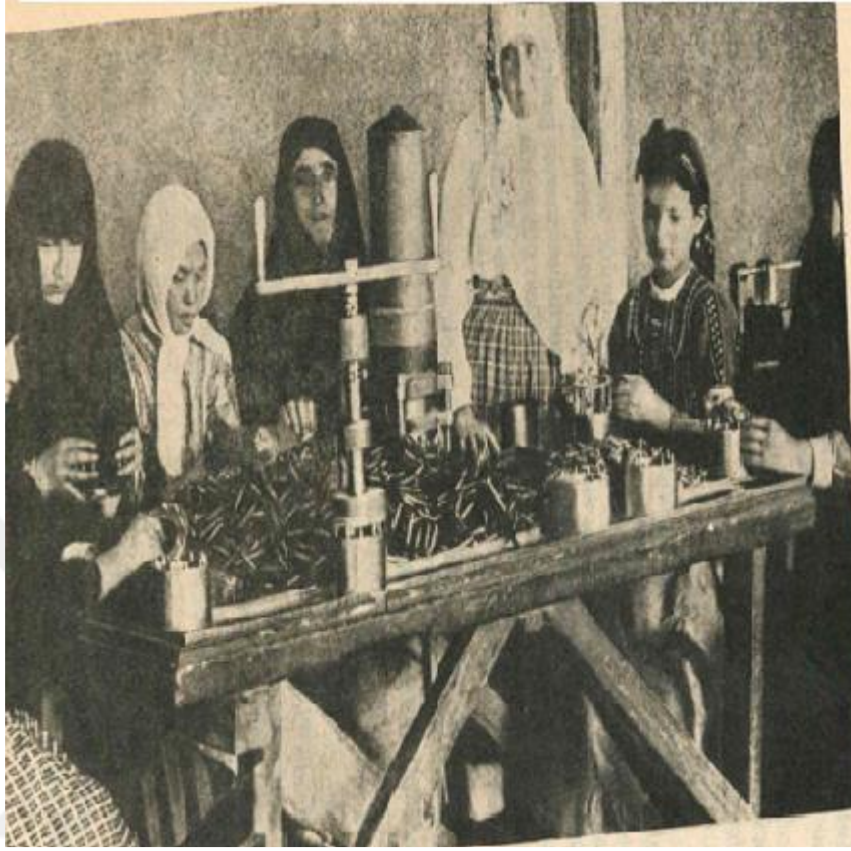
Fotoğraf 11: ATASE Arşivi, İSH-Albüm No. 5, Fotoğraf No. 042. Türk Kadını, çocuk, ihtiyar demeden Cephane İmalinde.