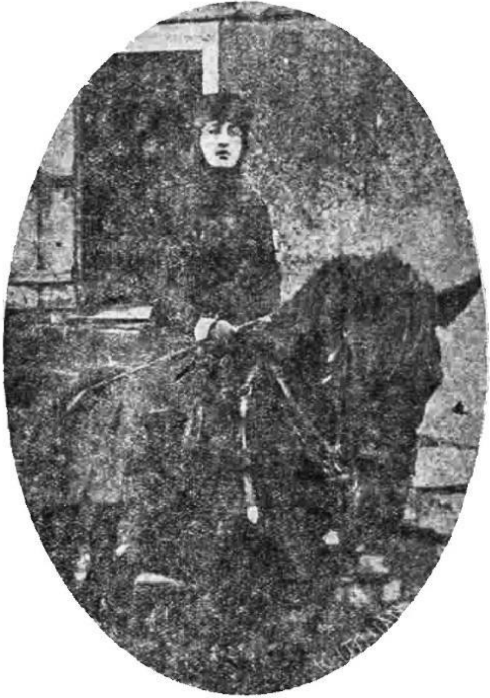
Fotoğraf 29: Halide Edip Hanım, Vakit Gazetesi , 8 Eylül 1921, s.1.