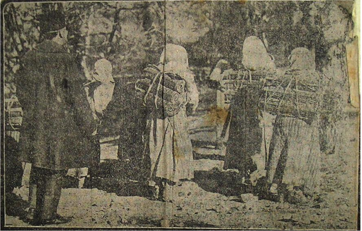
Fotoğraf 19: Cephe gerisinde ordunun cephanesini taşıyan kadınlar, Akşam, gazetesi ,31.08.1922, S.1414, s.1