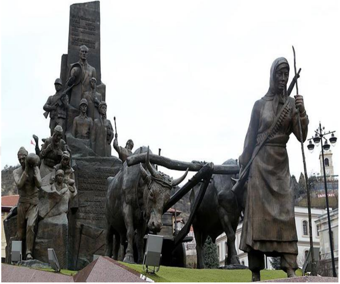
Fotoğraf 15: Cephane ıslanmasın diye üzerlerindeki battaniyeyle cephaneyi örtüp, kundaktaki çocuğuyla şehit olan Şerife bacının Kastamonu/Seydiler ilçesinde bulunan anıtı.