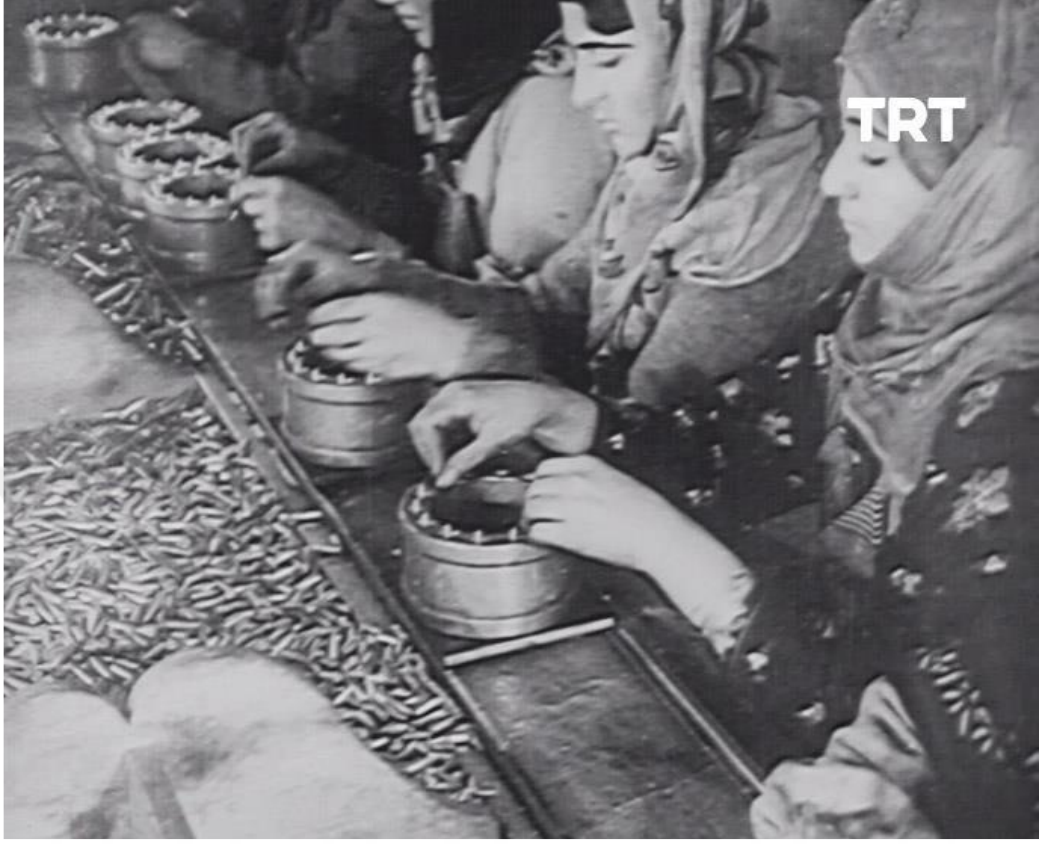
Fotoğraf 12: TRT Arşivi, Türk Milletinin Kurtuluş Savaşı Hazırlığı, Video Görüntüsü, 04.34.