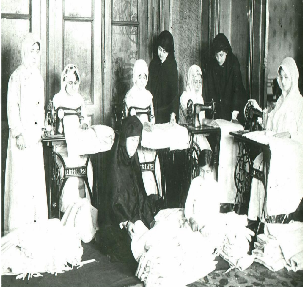
Fotoğraf 13: Kadınların yoksullara ve askerlere giysi üretimi, İleri Gazetesi , 4 Haziran 1920, s. 1.