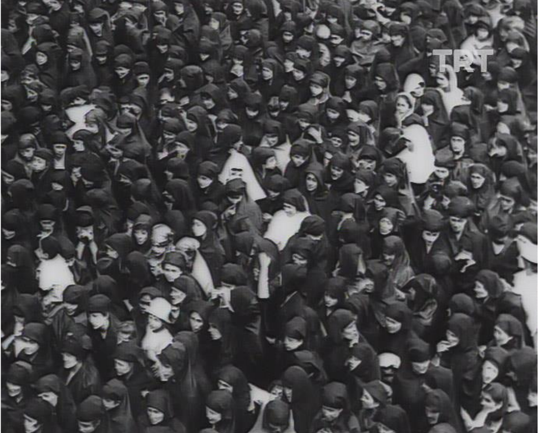
Fotoğraf 1: Sultanahmet Mitingi-Kadınlar Miting Meydanında, Video Görüntüsü-01.55.