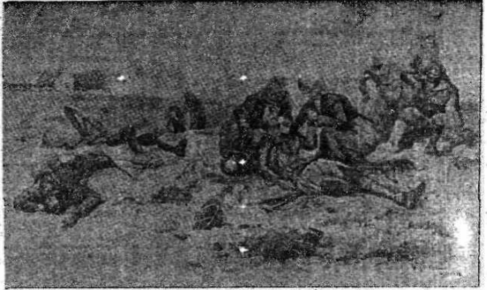
Aydın savaşının gazileri zeybeklere kadınlarımız fedakârcâ yardım ettiler. Yukarıdaki tabloda yaralı zeybeklerin yaralarını sararlar görülmüyor.