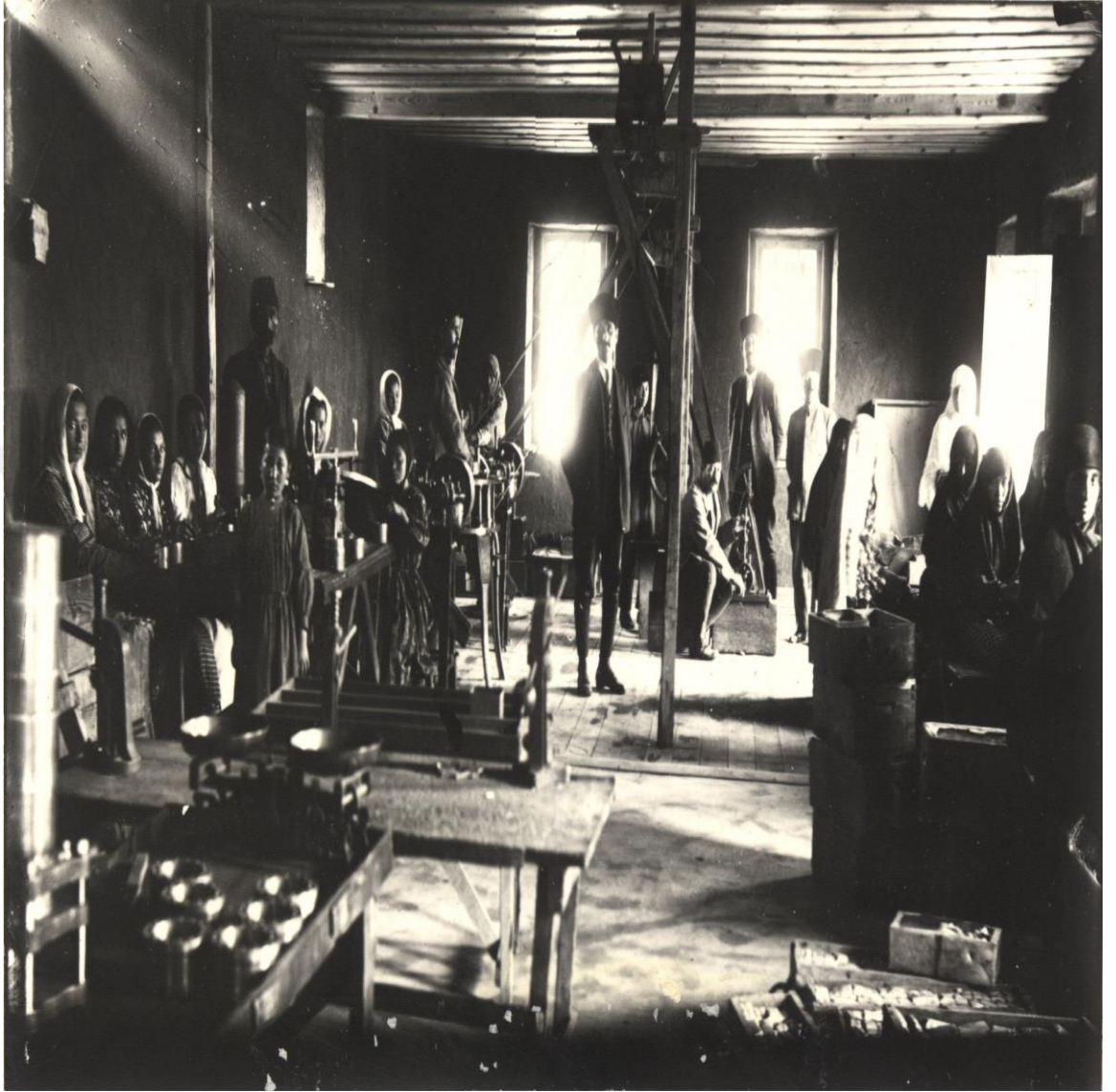
Fotoğraf 17: Kadınlar fişek doldururken. SH. Albümü , Albüm No:5, Sayfa No:21, Fotoğraf No:65.